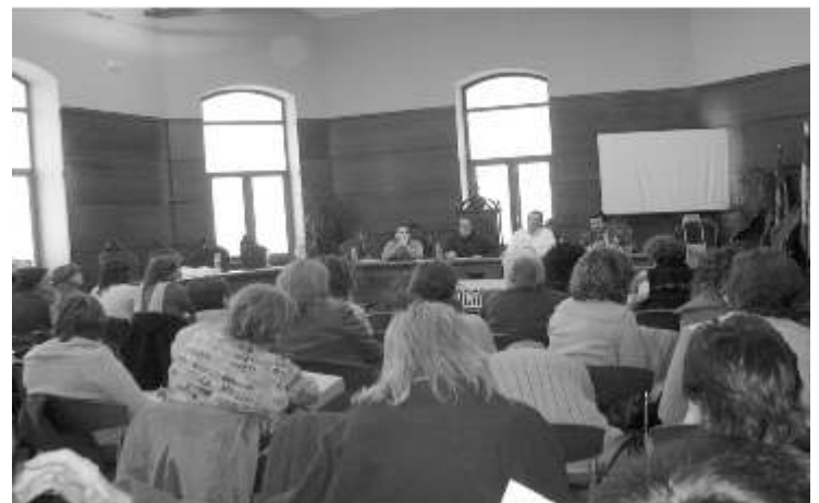
Instantánea de las Jornadas Comarcales celebradas en Cheste, sobre SS.SS. Especializados de Atención a Familia e Infancia.